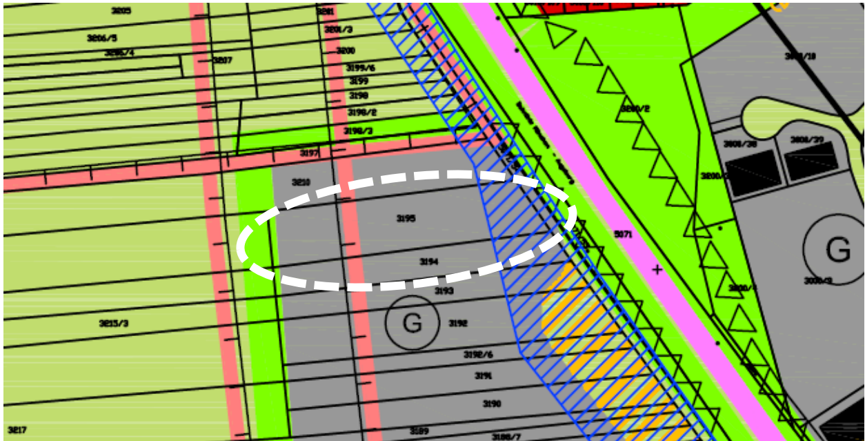
Abbildung 1: Auszug aus dem wirksamen Flächennutzungsplan, o. M.