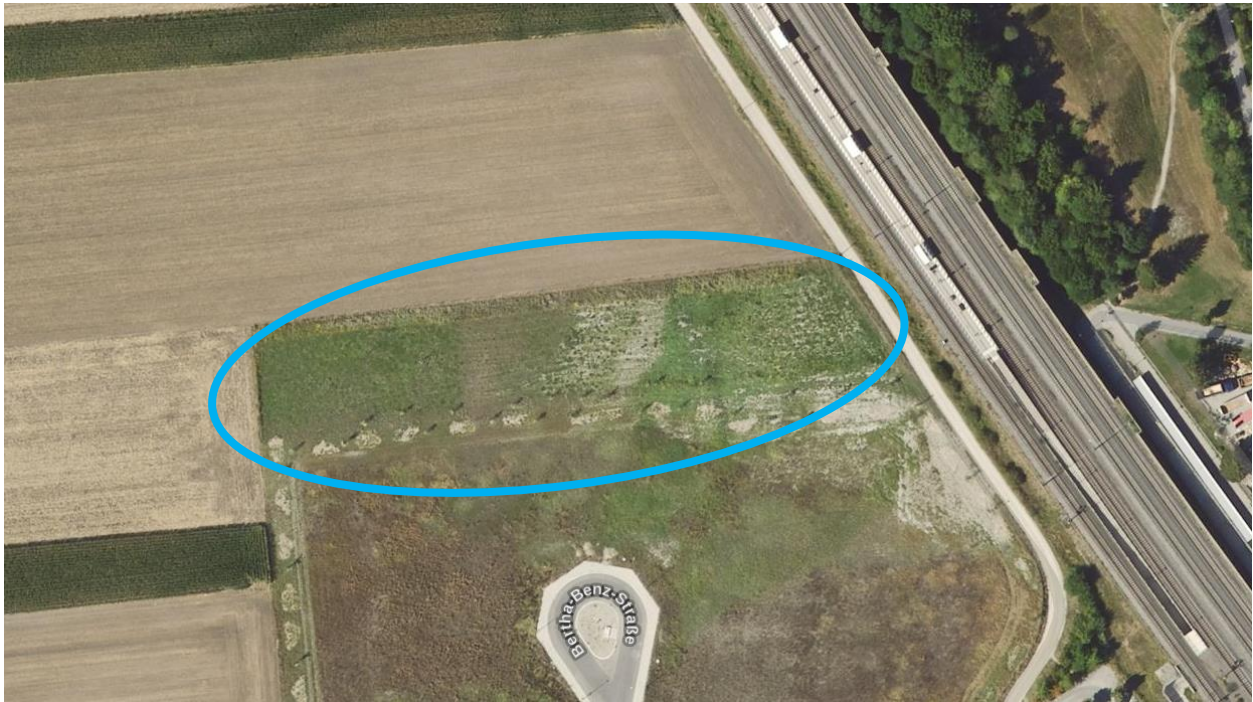
Abbildung 5: Luftbild vom Plangebiet, o. M.