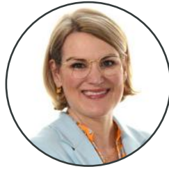
Eva Weber Oberbürgermeisterin der Stadt Augsburg